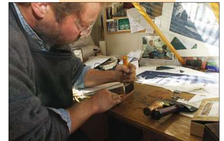
KLARGJØRING: Kobberplaten rubbes og ripes i alle retninger.