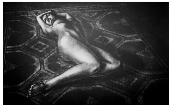
AKT: «Modell og teppe» av Jon Olav Helle.