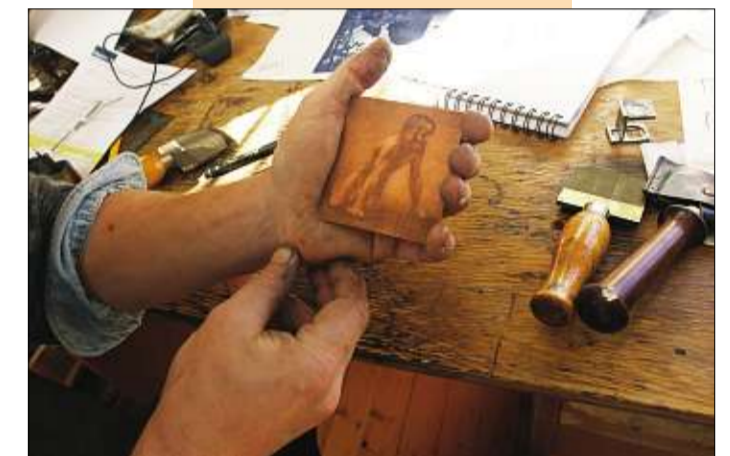
FERDIG TRYKKEPLATE: Etter bearbeiding blir ripene til lys og skygger. Slik kan en ferdig plate se ut før trykking.